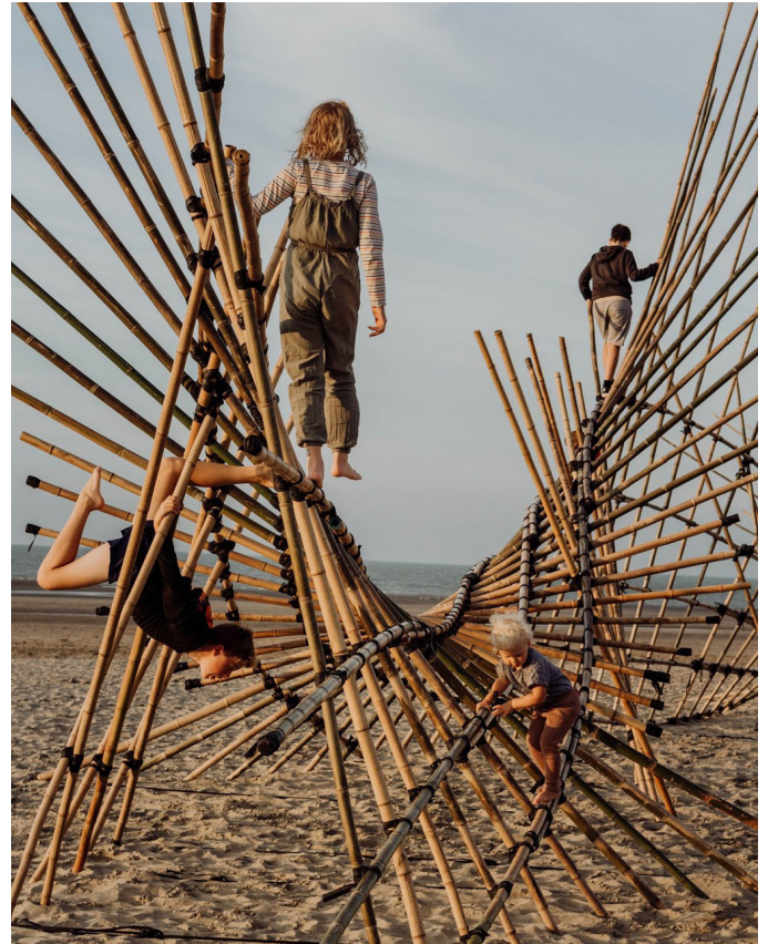
Dunkerque /// Plage de Malo