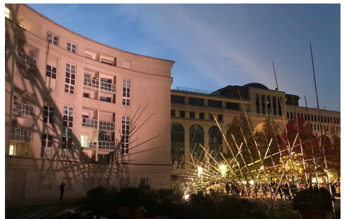
ZAT /// Montpellier