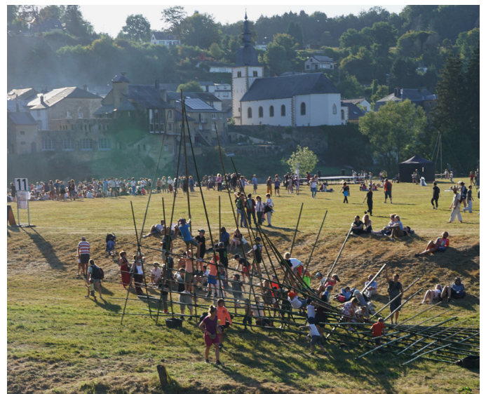
Festival de Chassepierre /// Belgique