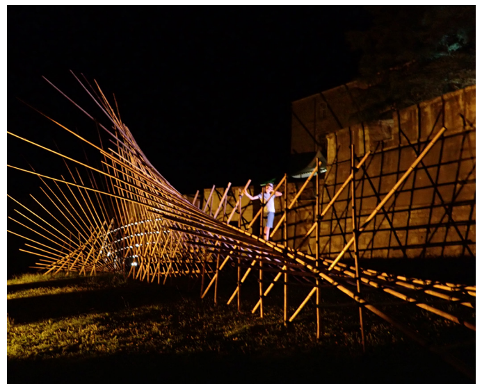
Festival Cratère-Surfaces /// Alès