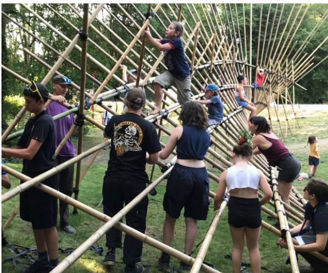
Festival Les Sarabandes /// Rouillac-Douzat