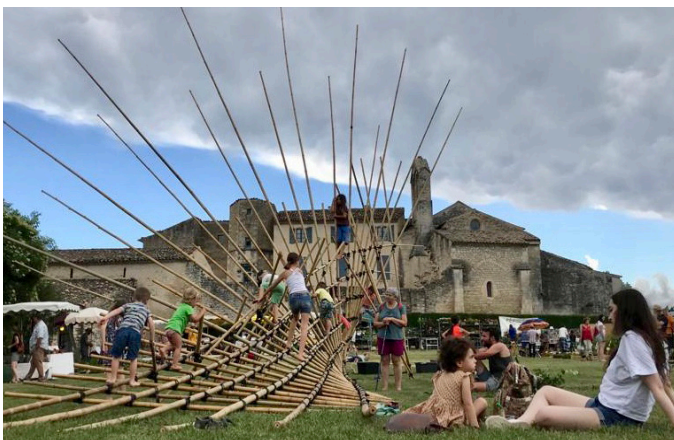
Musée de Salagon /// Jardins extraordinaires