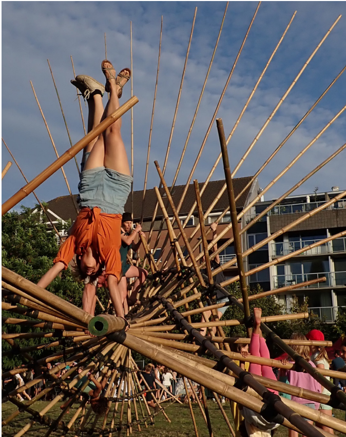
Festival MIRAMIRO /// Gand-Belgique

et prend place le temps d'un rassemblement commun