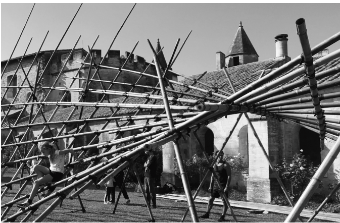
La Chartreuse-CIRCA CNES /// Villeneuve Lès Avignon